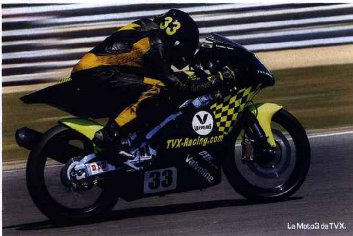
La Moto3 de TVX.

Le week-end de Lédénon n'a pas été de tout repos pour la fédération, le moto-club et le circuit organisateurs... Un gros contentieux entre la municipalité et le propriétaire du terrain du circuit a bien failli rendre impossible le déroulement de l'épreuve. Après plusieurs sombres rebondissements, le préfet a finalement délivré son arrêté préfectoral le vendredi midi. Incroyable, quand on sait que le circuit de Lédénon est dorénavant qualifié comme l'un des circuits les plus sécurisés de France.